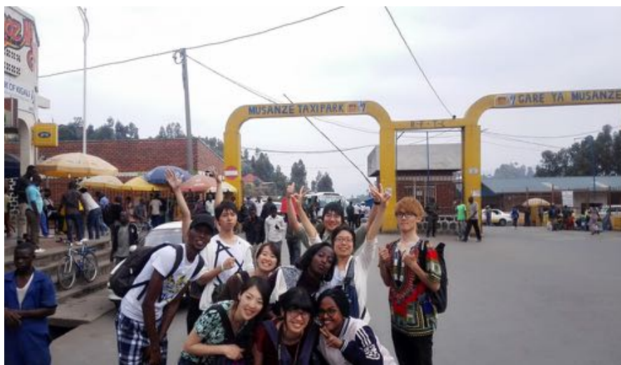
1 My Favorite Picture!