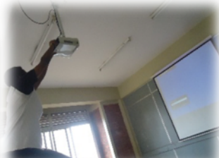
Leandre preparing the