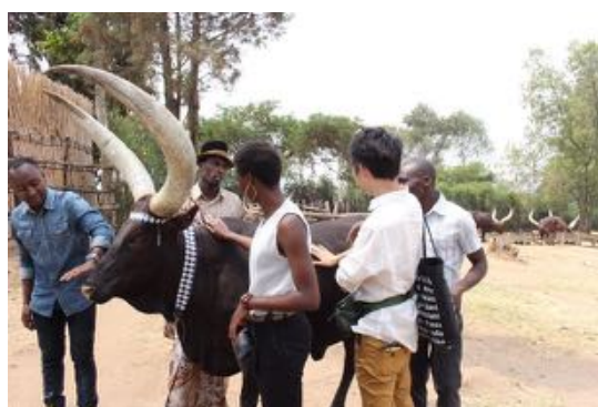
〈メンバーと敷地内で飼育されている牛〉