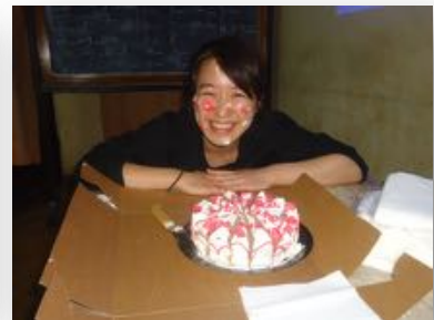
Celebrating yumeko's BD

For my last day in the conference, we visited drone delivering blood in Muhanga district where we learned about how Rwanda is using technology in health sector to save human life and after this we visited campaign against genocide museum where we learned many things about RPF battle that stopped genocide and saved many people and the strategies used during this project as well as the main objective of rescuing people's lives.