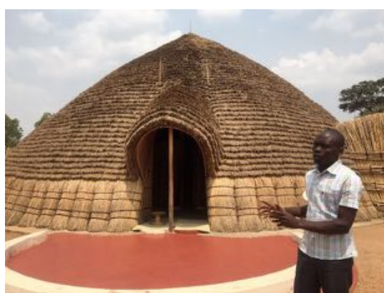
〈国王の旧宮殿とガイドさん〉