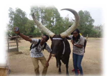
Posing for selfie