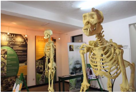
(カリソケ研究センター内)