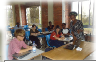
During presentation by

During the second day, we went outside of Kigali and we went to visit King's palace at Nyanza in southern province of Rwanda and we experienced the outside of the capital city, everybody was happy about the country and how it is safe everywhere, and we learned about traditional Rwanda, traditional buildings and the role played by different kings during expansion of Rwanda;