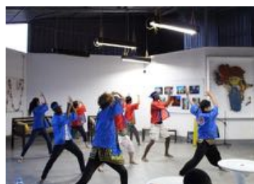
(両国学生のソーラン節)