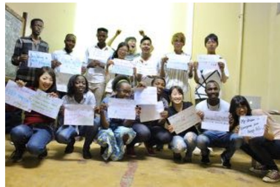
メンバー全員での記念写真

これからの世代を担う若者同士で、夢についてシェアできたことはとても有意義であった。