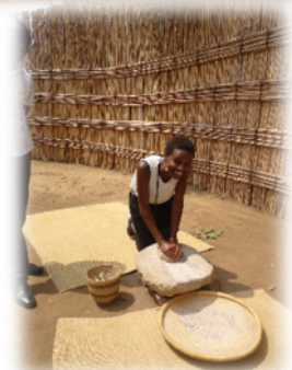
Girls learning how to use traditional mill