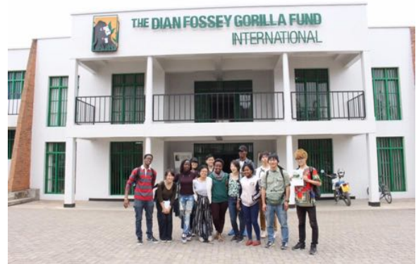
(カリソケ研究センター前にて)

その後ゴリラの基礎知識や過去から現在に至るゴリラ研究の進展、そして現在観察を行っているゴリラの群れの様子など、研究の成果等をスタッフの方から伺った。