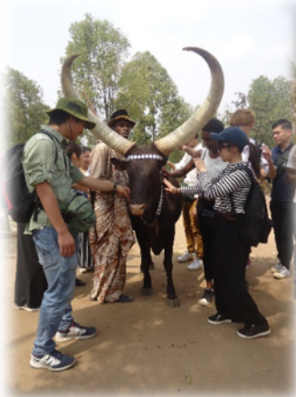
Taking picture with the palace

During the second day, we went outside of Kigali and we went to visit King's palace at Nyanza in southern province of Rwanda and we experienced the outside of the capital city, everybody was happy about the country and how it is safe everywhere, and we learned about traditional Rwanda, traditional buildings and the role played by different kings during expansion of Rwanda;